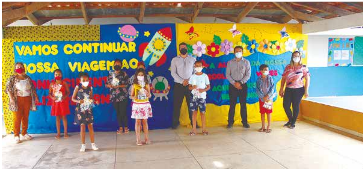
Alunos e professores da Escola Sousa Aguiar receberam a equipe do Sicredi para palestras