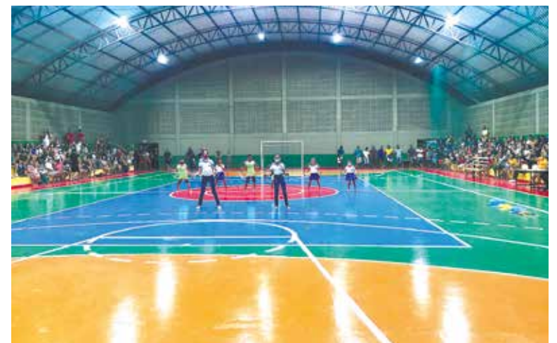
População recebeu Ginásio Miguel Ramos Avelino revitalizado

A Prefeitura de Tupirama realizou, no dia 10 de novembro, a 29ª Audiência Pública de Prestação de Contas. Foram apresentados os relatórios contábeis e financeiros, bem como as ações desenvolvidas durante o primeiro semestre de 2021. Na reunião, a comunidade teve oportunidade de tirar dúvidas