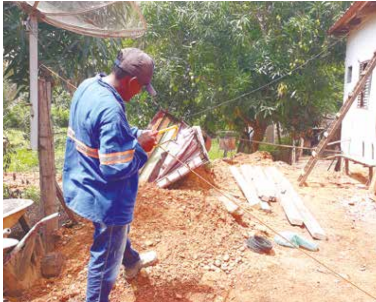
Nove casas estão sendo reformadas na primeira etapa da ação

As obras contam com investimento de R$ 754,7 mil feitas pela gestão municipal, sendo executadas através da