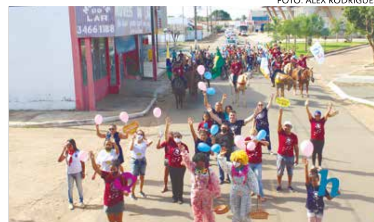
Voluntários do Hospital de Amor realizaram carreata em Pedro Afonso