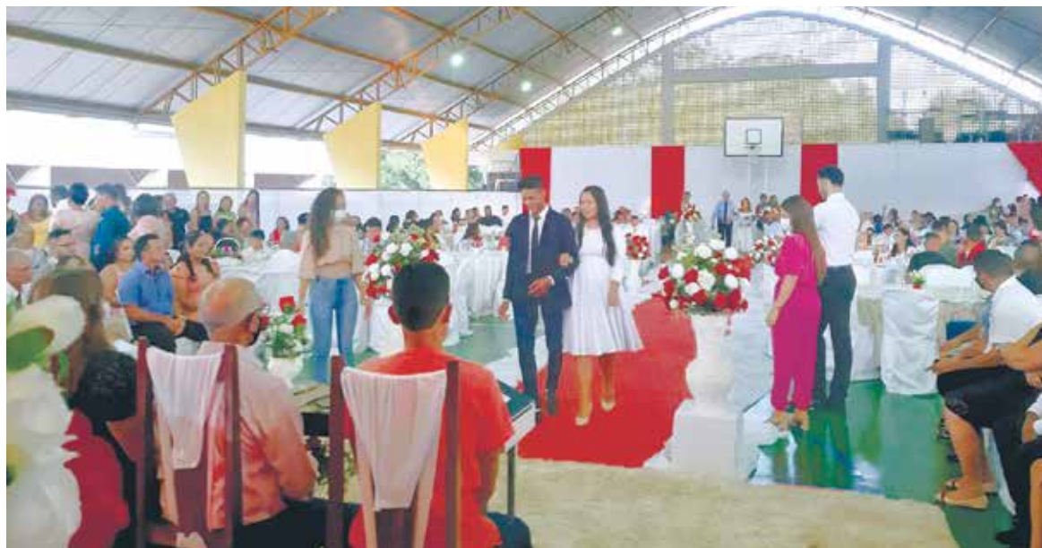
Evento organizado pela prefeitura uniu 32 casais de várias famílias da cidade

“Tínhamos um sonho em nos casar e com essa oportunidade maravilhosa conseguimos concretizar nossa linda história. Só temos a agradecer a todos que fizeram com que