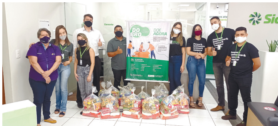
Colaboradores e associados do Sicredi estão empenhados na campanha