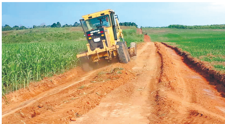
Manutenção nas estradas atenderá todas as comunidades rurais

tregou 300 cestas básicas, em parceria com o Governo do Estado, e 63 kits alimentares adquiridos de pequenos agricultores por meio dos Programas de Aquisição de Alimentos (PAA) e Compra Direta Local da Agricultura Familiar,