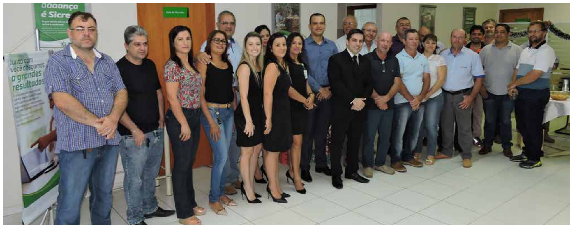
Apresentação do novo gerente do Sicredi foi prestigiado por representantes de vários segmentos