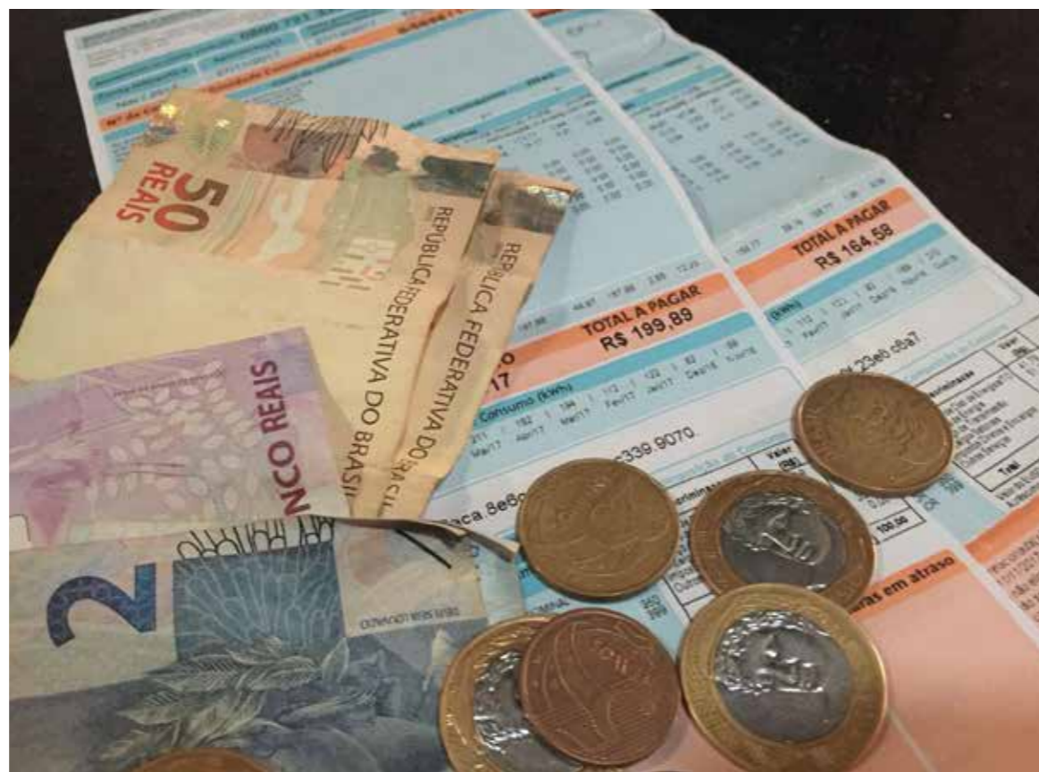
Consumidores reclamam dos constantes aumentos da tarifa de energia elétrica

Implantado em 2015, o Sistema de Bandeiras Tarifárias é um dos fatores que vem colaborando para o aumento da tarifa de energia elétrica duran-