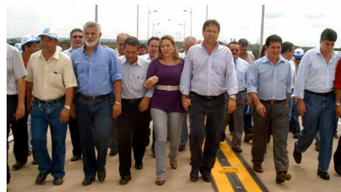
Dia 21 de dezembro de 2007: autoridades e multidão caminham pela primeira vez na ponte

Já o governador Marcelo Miranda afirmou que com a ponte o transporte de produtos tornou-se mais ágil e dinâmico, provocando a redução de preços e aumentando a competitividade do agronegócio local no comércio interno e até no exterior. Para ele, é incontestável o desenvolvimento das cidades localizadas à margem direita do Tocantins, a partir da construção dessa ponte, pois ela é o elo que interliga três grandes rodovias federais: BR-153, BR-010 e a BR-235. “Aquele 21 de dezembro de 2007 foi um dia histórico. Seja pelos benefícios adquiridos pela população de Tupirama e Pedro Afonso, das cidades circunvizinhas ou pela contribuição ao processo de desenvolvimento advindo a partir dessa obra que mudou a vida de milhares de pessoas e de empreendimentos”, completou.