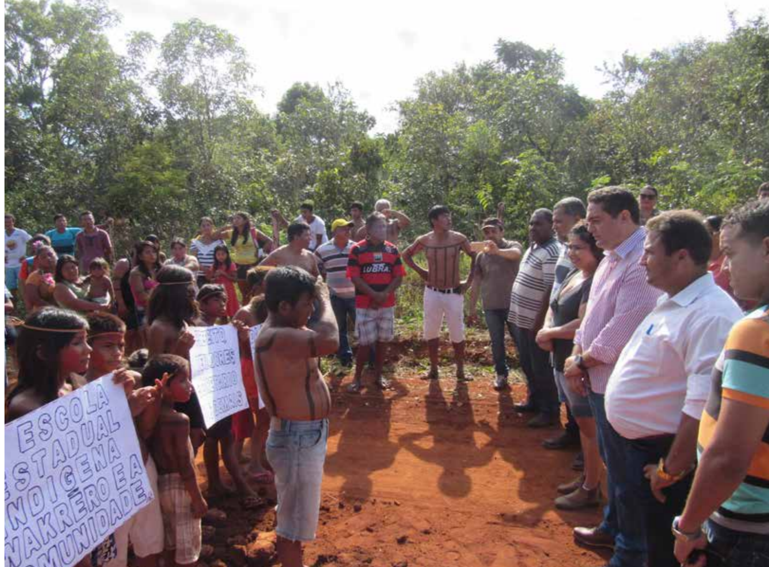
Além de obras estruturais, a Prefeitura de Pedro Afonso realizou a Agenda Positiva que atendeu mais de 2 mil pessoas de várias regiões

Lançada em março deste ano, a Agenda Positiva em comemoração aos 170 anos de Pedro Afonso reuniu uma série de ações que foram realizadas pela gestão em diversas regiões. Na zona rural centenas de cidadãos tiveram acesso a serviços desde