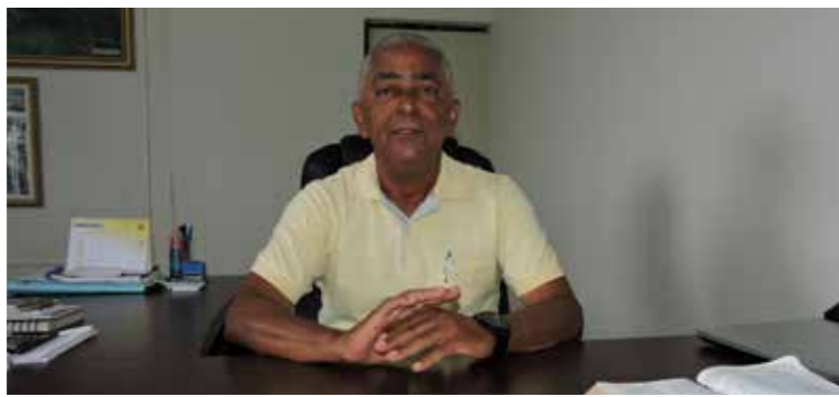
Prefeito de Tupirama prestou contas das ações realizadas em 2017

Na área educacional, o prefeito ressaltou a continuidade da parceria com o Governo do Estado, no transporte escolar, apesar do serviço está aquém do esperado. Outro ponto abordado pelo gestor foi a questão do fim do regime integral nas escolas municipais da cidade, considerando um grande avanço. “Porque entendemos que nossas crianças, com a idade que elas têm, precisam ter um afeto mais próximo com o pai e a mãe. Elas estavam