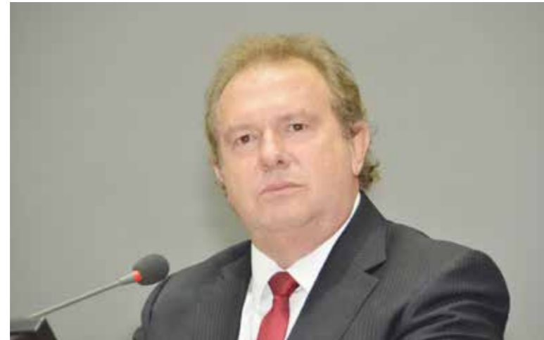
Carlesse disse que poder público precisa se unir contra transposição

Os deputados aprovaram no dia 12 de dezembro, em segunda fase de votação, o projeto que proíbe o uso de águas de rios estaduais, como os das nascentes do Tocantins, para uso em transposição de rios federais. O autor é o deputado Mauro Carlesse (PHS).