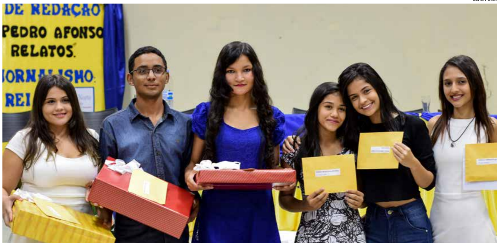
Alunos vencedores do IV Concurso de Redação, Educação e Jornalismo: Cristo Rei e Centro-Norte Notícias