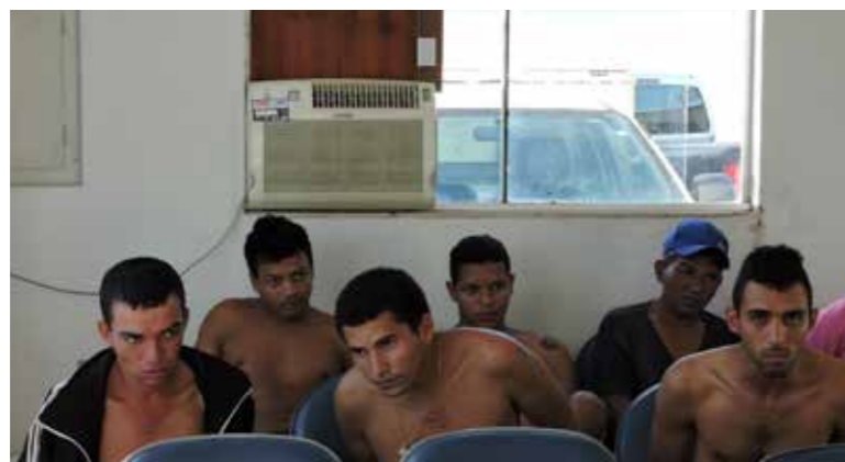
Investigações da Polícia Civil revelam que grupo preso é acusado de compor quadrilha que movimentava R$ 600 mil por ano

mes alvos na operação 'Vertentes' já haviam sido mencionados em uma das fases da operação 'Renascimento', desencadeadas em 2013 e 2015, quando foram cumpridos vários mandados de prisão e de busca e apreensão em Pedro Afonso, Bom Jesus do Tocantins e Tupirama.