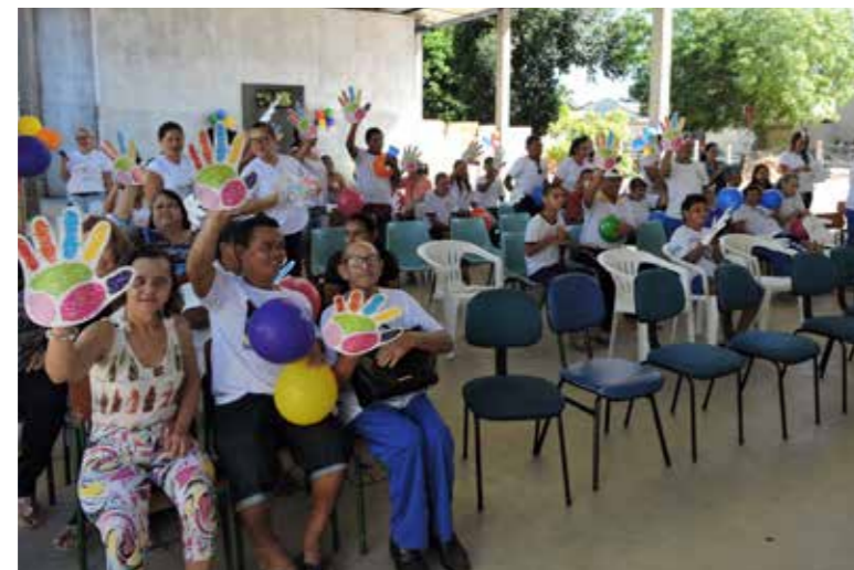
Voluntários realizam campanha para melhorar estrutura da Apae

“A Praça IFTO é nossa!” é outra atividade realizada dentro da programação do Dia de Cooperar, dedicada a manutenção da praça, onde os parceiros cuidaram das árvores, plantas, pedras e garrafas PET instaladas no local.