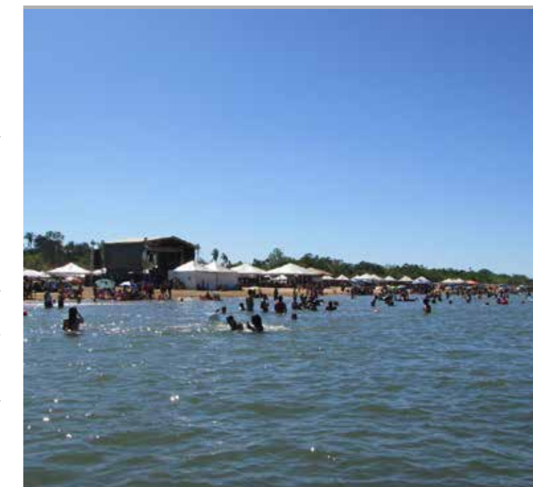
Tupirama recebe muitos turistas após investir na praia Bom Será

A praia do Bom Será fica às margens do rio Tocantins, a 7 quilômetros de Tupirama, 4 quilômetros da BR-235, 10 quilômetros de Pedro Afonso e 42 quilômetros de Guarai.