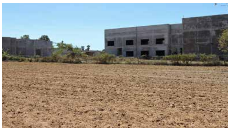
Obra vai custar R$ 10.494.802,69 e quando estiver pronta, a escola de Pedro Afonso terá capacidade para atender 1.500 alunos

Em 2016, através de nota, a Seduc informou que os ser-