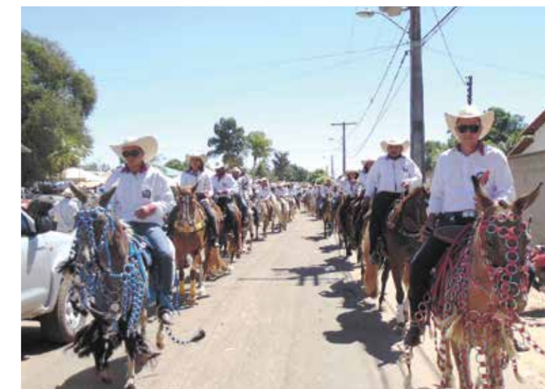
Cavalgada reuniu 28 comitivas de várias cidades

As obras da escola contemplaram reforma e ampliação do prédio e tiveram um investimento de R$ 1.760.718,50. O recursos do Banco Mundial (Bird), por meio do Programa Estrada do Conhecimento.