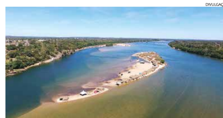
Praia do Duga e Ilha do rio Tocantins atraem muitos visitantes

A ilha localizada no rio Tocantins, entre Pedro Afonso e Tupirama, chama cada vez mais atenção. Com acampamentos que se iniciam ainda no final do mês de maio e seguem até a metade de setembro, a praia com grandes formações rochosas que formam uma paisagem deslumbrante, fica repleta de famílias e grupos de amigos que acampam. O acesso é feito de barco, que percorre cerca de 700 metros da rampa do antigo porto da balsa, ao lado da Praia do Duga. O valor da passagem individual é de R$ 3,00.