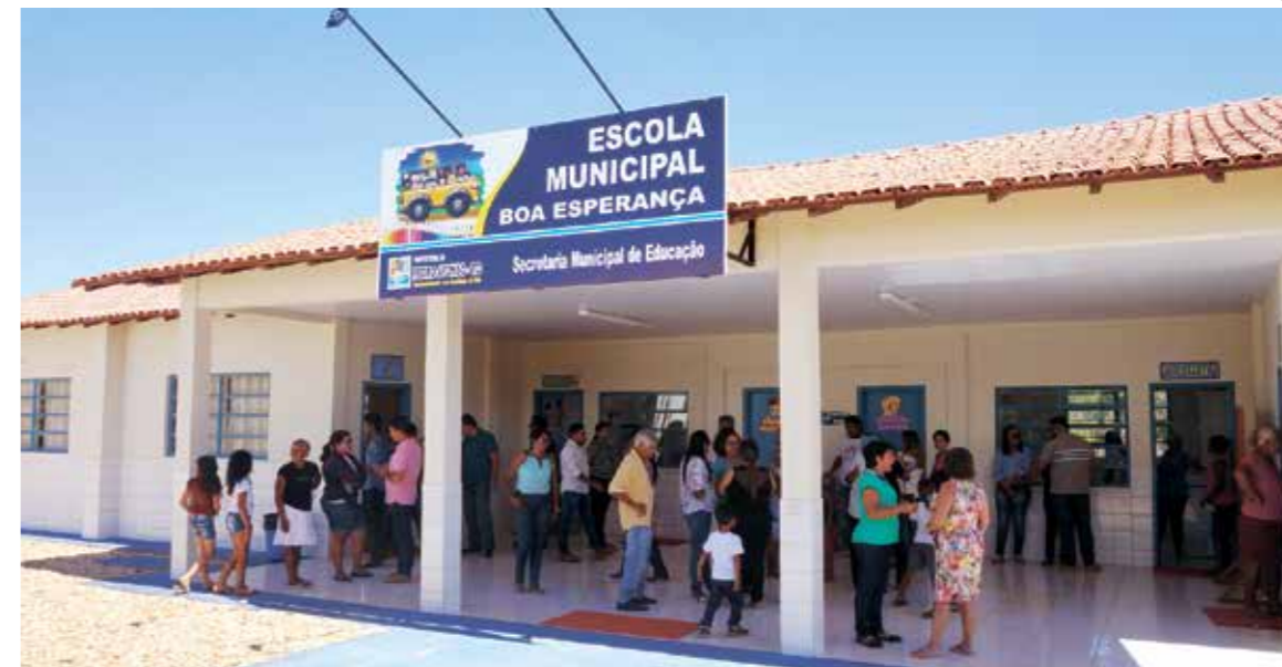
Escola atenderá crianças da Mata Verde, onde também foi entregue o sistema de abastecimento

Com duas salas de aula, uma sala administrativa, além de cozinha e dois banheiros, a nova sede da Escola Boa Esperança conta com estrutura totalmente adequada e beneficiará 42 crianças que cursam o ensino fundamental. Professora na região há mais de 35 anos, Lin-