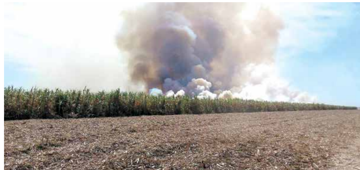
Fogo começou em canal e destruiu uma área de 150,18 hectares, parte dela de reserva legal