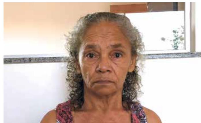
Dona Madalena corre risco de perder os movimentos das pernas