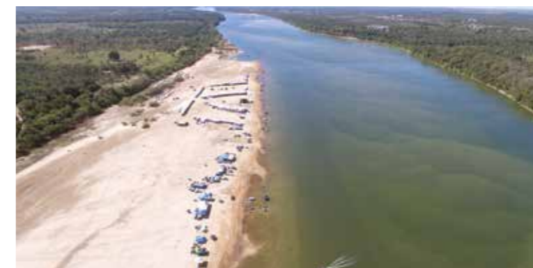
Depois de quase 10 anos, o Bom Será voltou a receber estrutura

Tupiramense e militar da reserva, Felizardo Ramos considera o “resgate” da praia Bom Será como algo singular e importante para toda a região. “Houve um esforço muito gran-