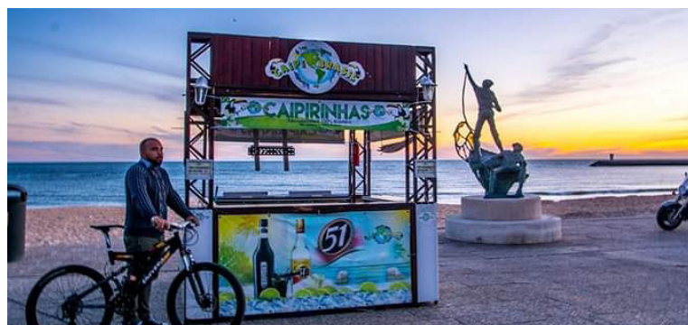
“Tudo parou, foi uma bomba que caiu no mundo”, lamentou Télio