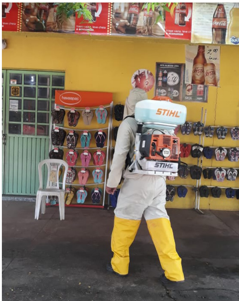
Funcionário realiza desinfecção em comércio de Bom Jesus

Até o fechamento desta edição, segundo a Secretaria Municipal de Saúde, não havia sido registrado nenhum caso, confirmado ou suspeito, no município.