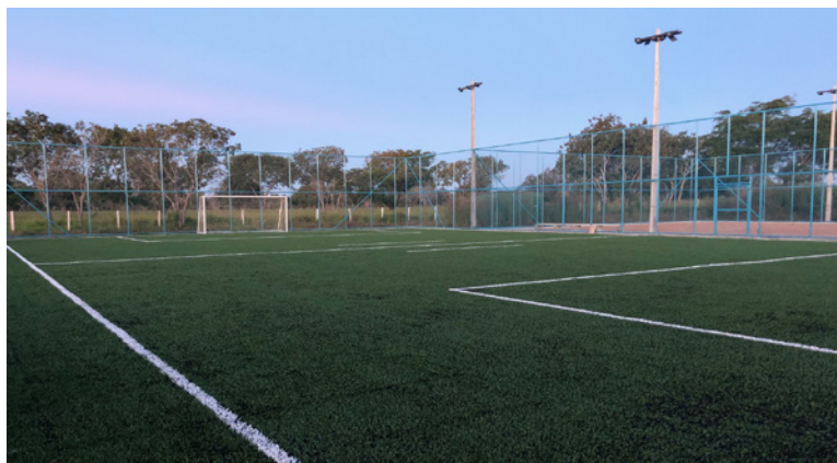
Complexo esportivo terá campos society e de vôlei