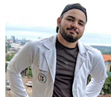
Ícaro enfrenta falta de produtos no Paraguai