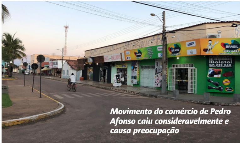
Movimento do comércio de Pedro Afonso caiu consideravelmente e causa preocupação

A diminuição do fluxo de clientes gera um efeito cascata